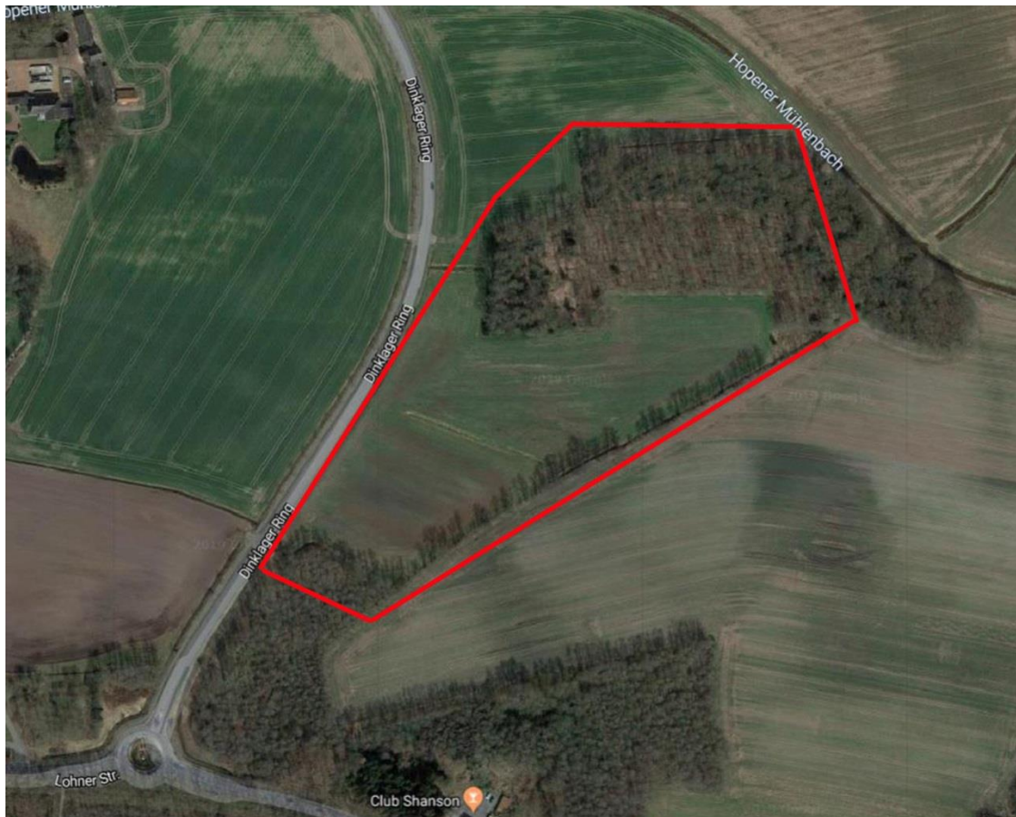
Abb. 1: Untersuchungsgebiet (rot markiert).