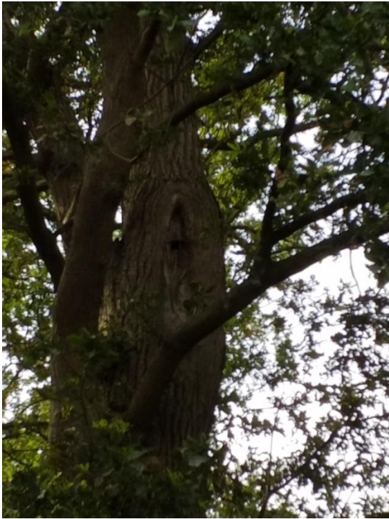
Abb. 4: Eiche mit Höhle