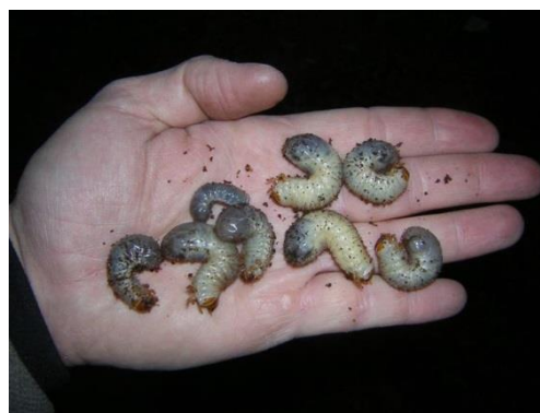
Abb. 3: Eremit, Larven