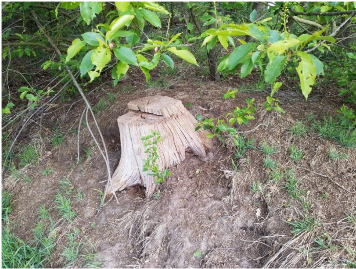
Abb. 6: Stubben.