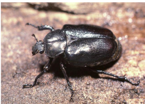
Abb. 2: Eremit, Weibchen

Der Eremit wird als prioritäre Art nach der Europäischen FFH-Richtlinie (Anhang II, IV) eingestuft und hat somit den höchsten Schutzstatus in Europa. In Deutschland ist die Art nach dem Bundesnaturschutzgesetz streng geschützt und wird in der Roten Liste Deutschland als „stark gefährdet“ (RL 2) geführt. Der Käfer ist bis zu 4 cm groß (Abb. 2), gehört zur Familie der Blatthornkäfer und ist in weiten Teilen Europas verbreitet. Hinsichtlich der Baumart ist der Eremit nicht besonders anspruchsvoll. Es werden alle Laubbaumarten besiedelt, die ein ausreichendes Dickenwachstum (mind. 70-80 cm Durchmesser) sowie die Entwicklung großer Mulmkörper aufweisen.